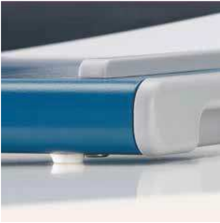
Rutschfeste GummifüÙe für einen sicheren Stand