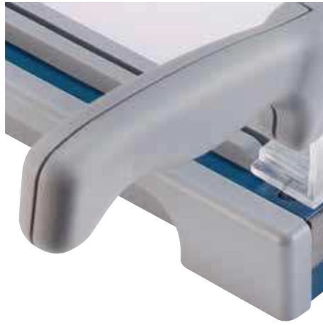
Ergonomisch geformter Handgriff sorgt für ermüdungsfreies Schneiden