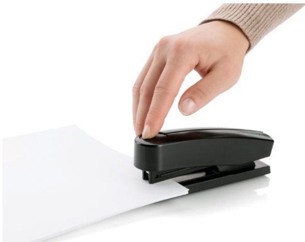
Schnell und einfach Heften mit den Novus Heftgeräten.