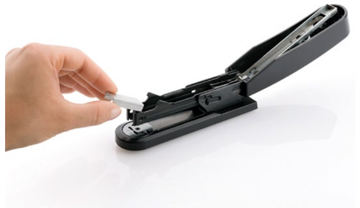
Oberlademechanik mit einfacher Klammerführung