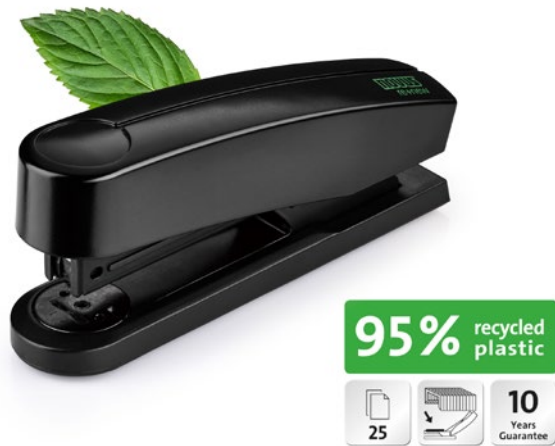
Novus B 2 re+new mit Piktogrammen