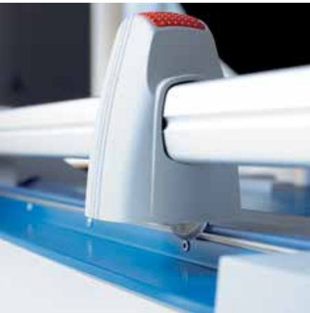
Rundmesser im geschlossenen Kunststoffkopf gewährleistet ein Höchstmaß an Sicherheit