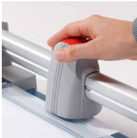
Ergonomischer Schneidekopf für eine komfortable Bedienung der Schneidemaschine