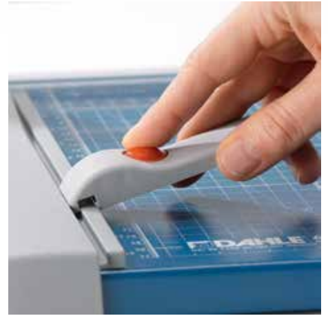
Verstellbarer Rückanschlag zur schnellen Formatfindung - auf beiden Winkelanlagen einsetzbar